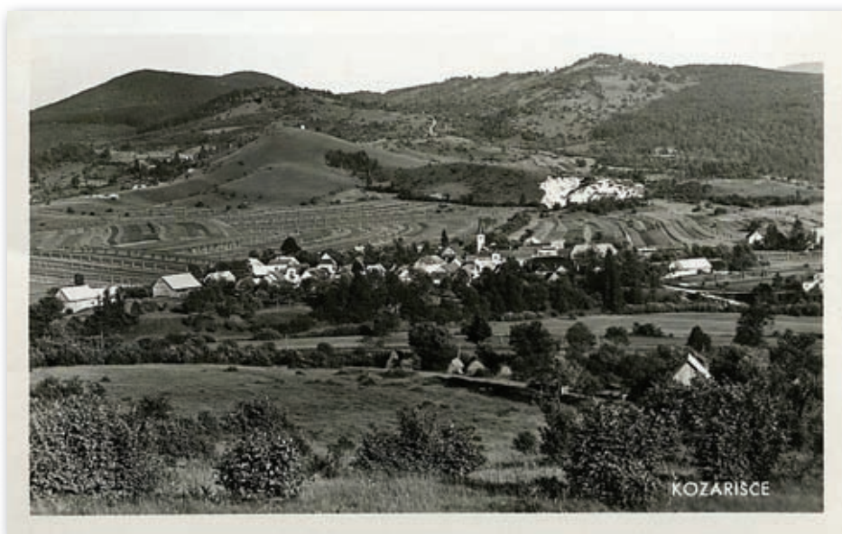
Kozarišče – Razglednica vasi z ostrnicami na polju

Na tej internetni strani objavljamo stare fotografije iz Cerknice in okolice – torej tudi iz Loške doline. To so fotografije najrazličnejših virov, ki jih objavljamo z namenom, da bi se ohranili spomini, ki so vezani na vsebino posamezne fotografije. Vabimo vas, da tudi vi prispevate svoje komentarje. Še posebej bomo hvaležni, če boste opisali dogodke, spomine ali celo osebe, ki so na objavljenih fotografijah.