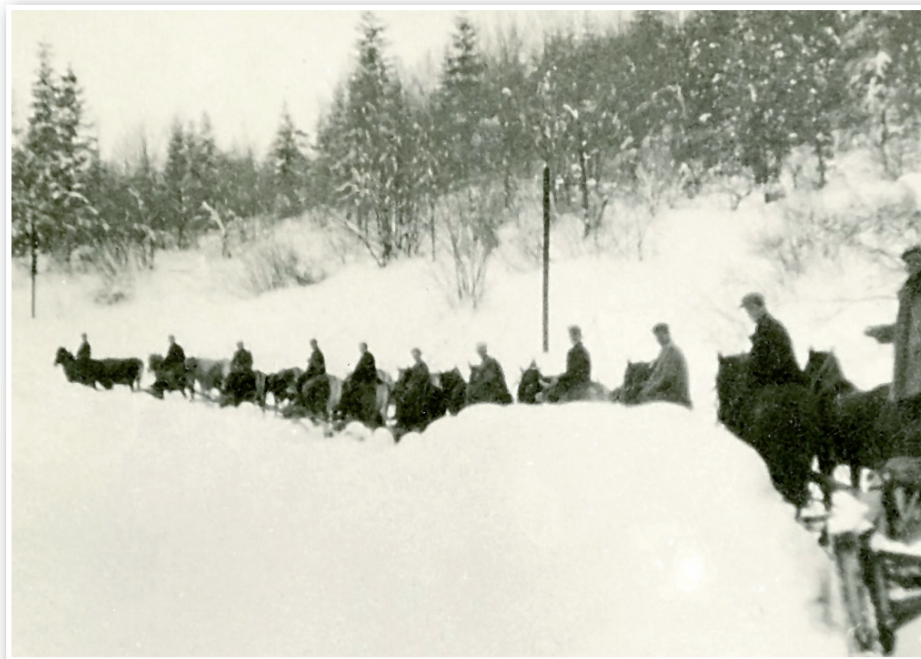
Pluženje ceste Podgora – Babno polje

Za prvim parom konj so bile zaprežene sanke. Sanke so s kjatno povezali v drugi vlečni par, pa spet sanke, kjatna, par in tako vse do pluga. Sanke so omogočale povezovanje živali in hkrati služile za prostor furmanu. Na