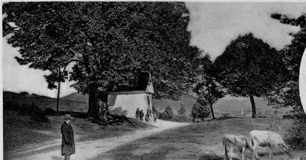
Kapelica na vrhu klanca s stoletno lipo ob stari cesti med Rakekom in Cerknico. — V desn. krogu: Solčni zašod na cerkniškem jezeru.