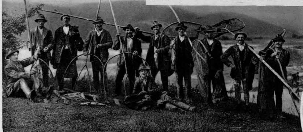
Skupina ribičev po bogatem ribolovu.

V desnem krogu: Pogled na jezero nekaj dni pred odtekom vode iz njega.