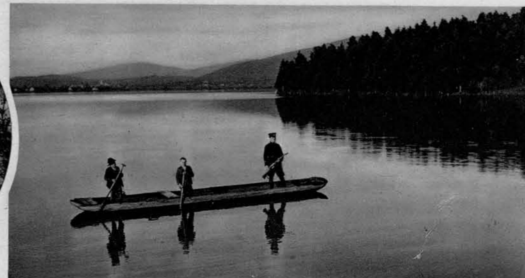
Pogled na Cerkniško jezero , ko je v njem še polno vode; v ozadju se vidi Cerknica. — Zgoraj, v levem krogu: Mošt v Cerkniškega jezera.