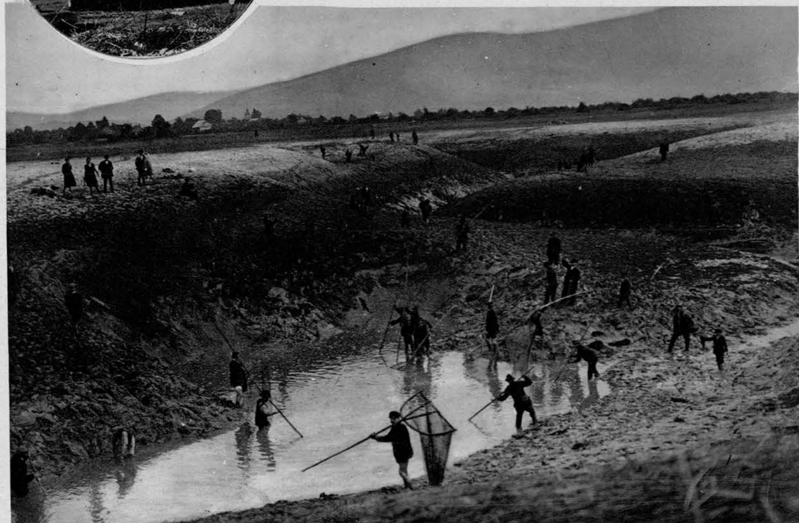
Usiňanje Cerkniškega jezera: Slika predočuje požiralnik „Rešeto“ , v katerega odteka voda iz imenovanega jezera: pogled na požiralnik pol ure pred odtekom vode vanj.