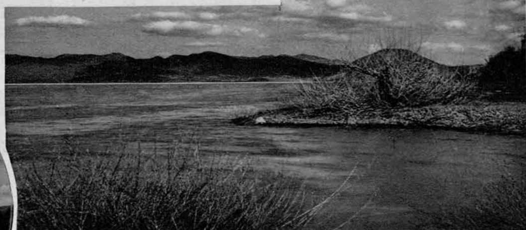
Pogled na Cerkniško jezero profi Novi Štifi.

V levem krogu: Cerkniško jezero , na levo v ozadju Cerknica.